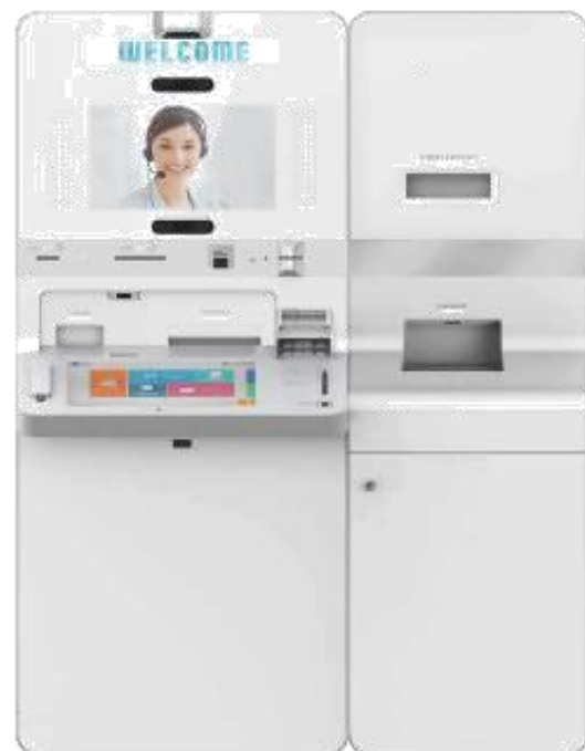
I60X/XL — A+B