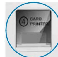
Карточный принтер отпечатков пальцев