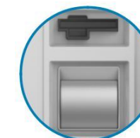
Приемник чеков штрих-кода