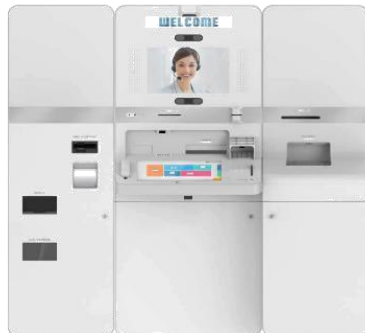
I60X/XL - A+B+C